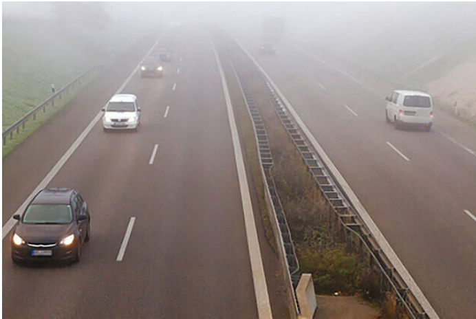
Amélioration de la visibilité

Le EVS1VS détecte et corrige les zones de l'image qui apparaissent floues en raison du brouillard, de la fumée, de la neige ou d'autres conditions environnementales afin d'améliorer la visibilité. C'est idéal pour visionner des séquences vidéo en extérieur.