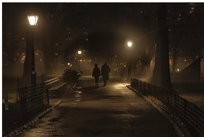
Sans amélioration de l'image