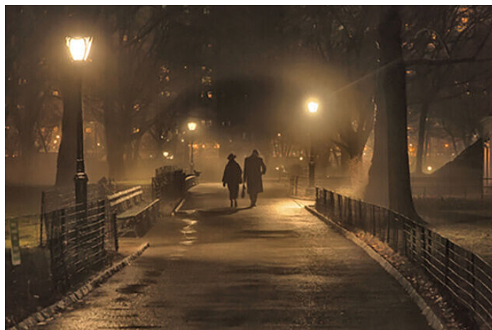
Avec amélioration de l'image

Le traitement de l'image est basé sur la théorie Retinex, dans laquelle les pixels sont optimisés individuellement.