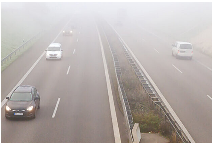
Zones de l'image qui semblent floues